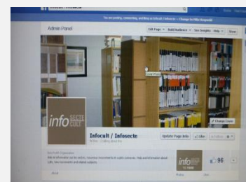
Info-Secte sur Facebook

http://infosect.freeshell.org/infocult/Options_FR.html